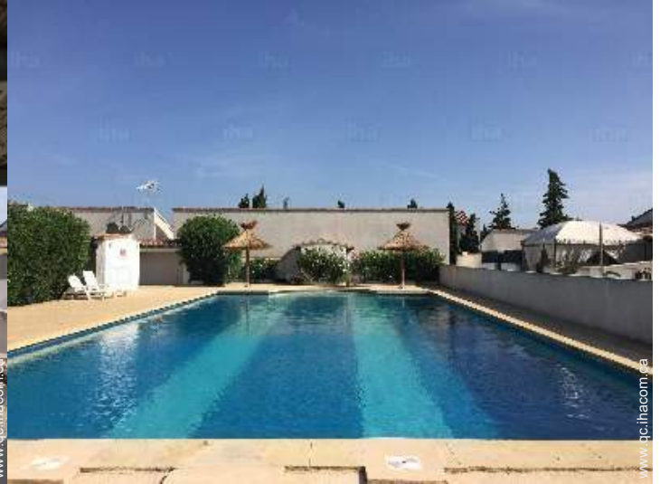
vue depuis la galerie