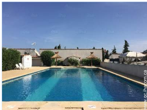
vue depuis la galerie