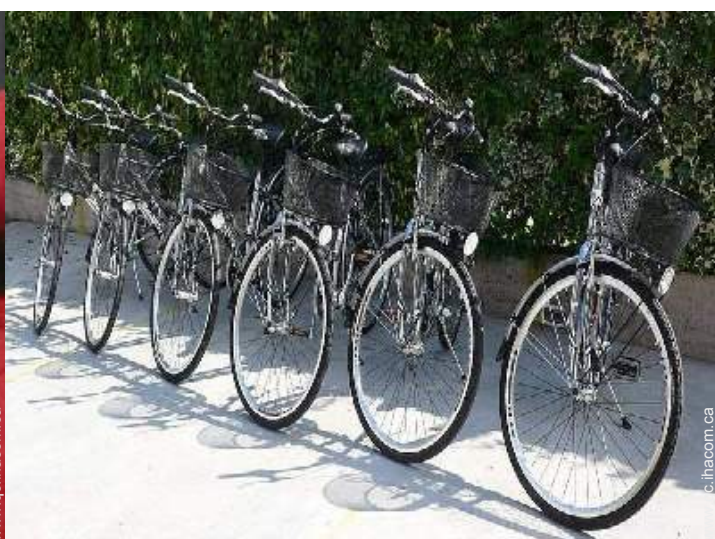
Equipements à disposition