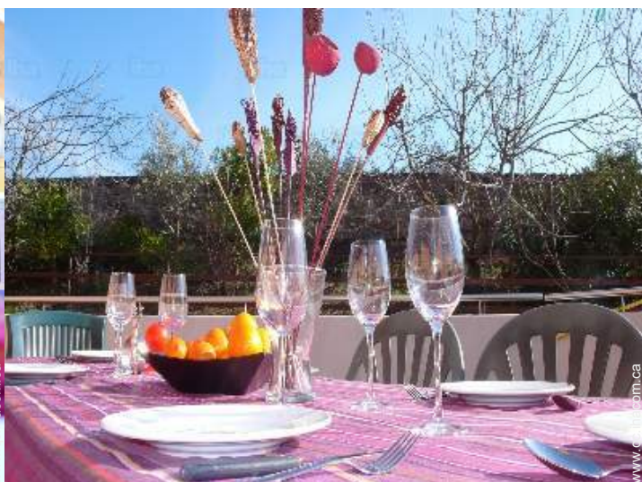
vue depuis la galerie