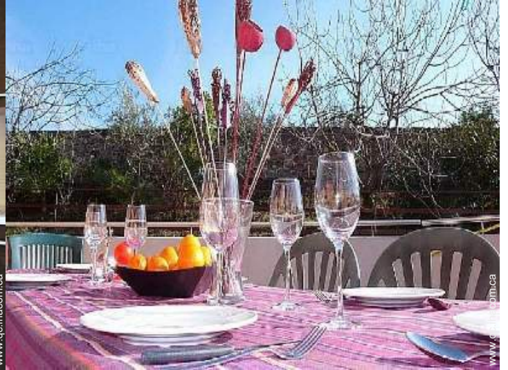
vue depuis la galerie