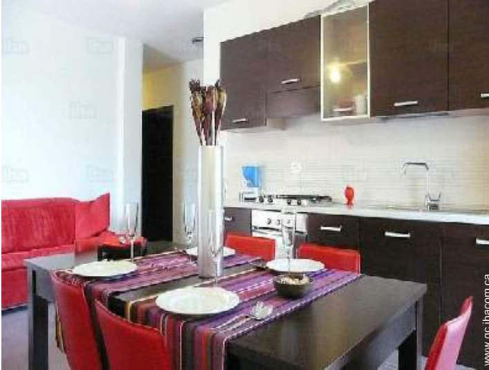
Confort intérieur et équipements