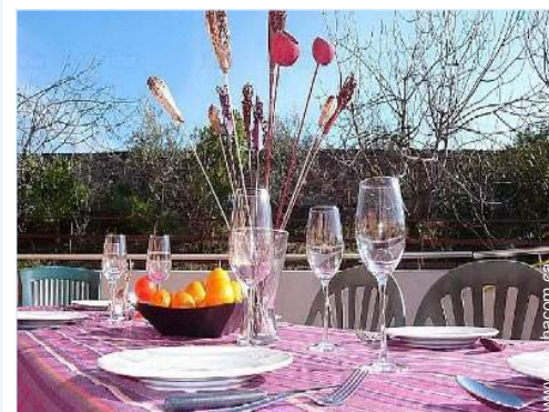
vue depuis la galerie