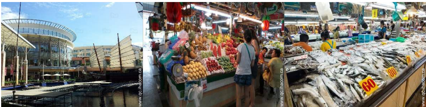
boutiques de luxe et marques