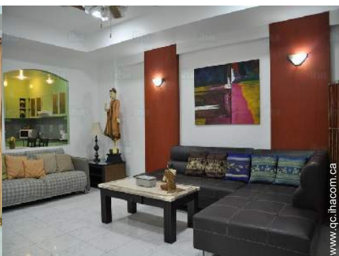
vue depuis la galerie