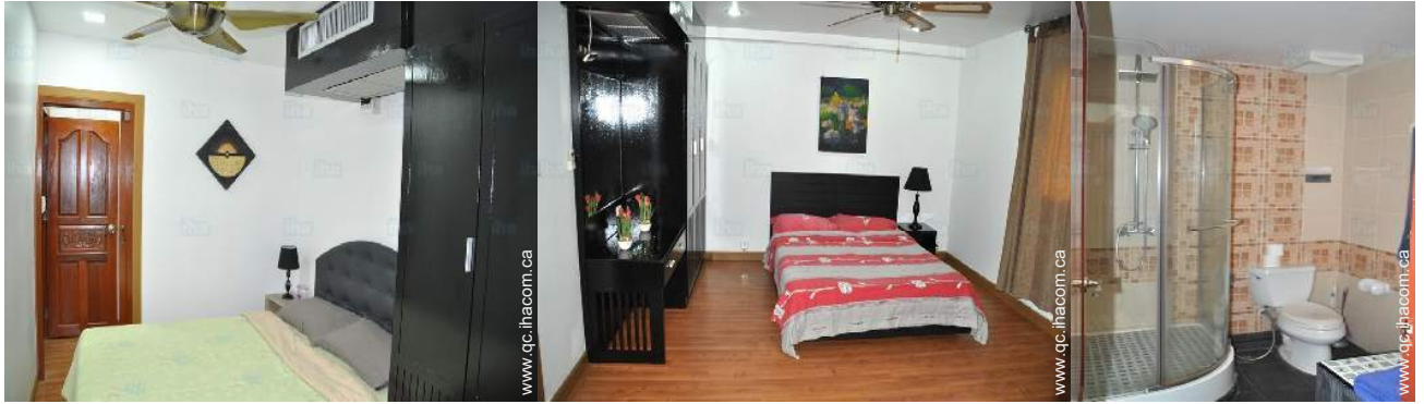
chambre du propriétaire