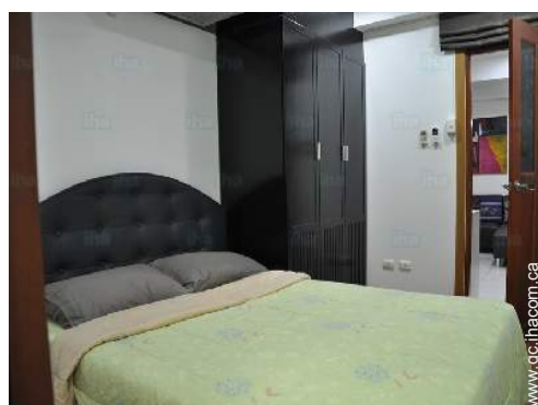
chambre du propriétaire