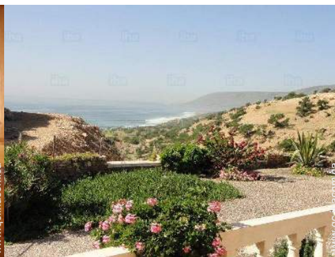
vue depuis la maison