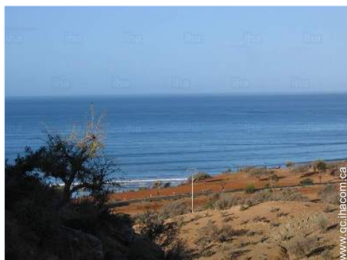
vue depuis la maison