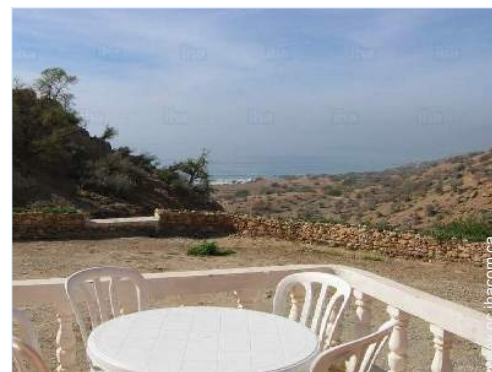
vue depuis la maison

Mer/océan 500m Plage de sable 500m Massif montagneux 25km