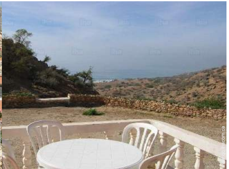
vue depuis la maison