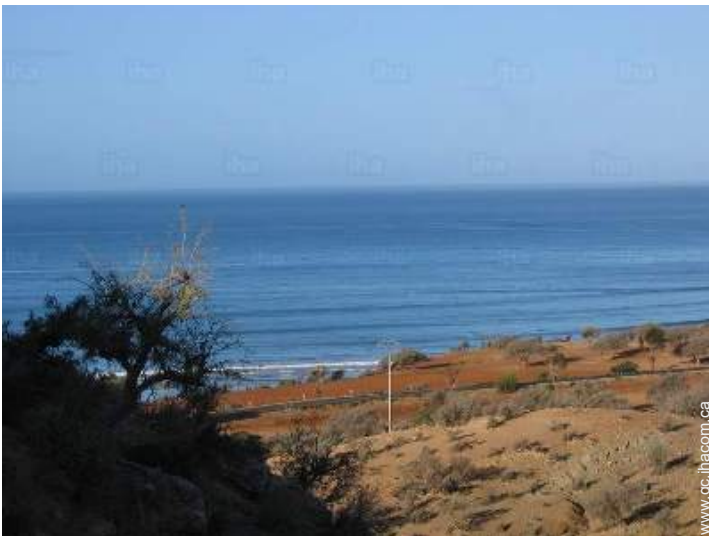
vue depuis la maison