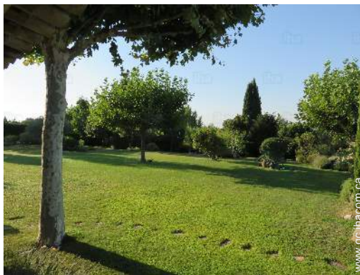
vue sur jardin/parc