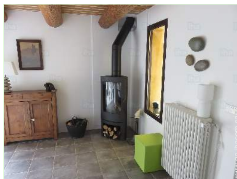
coin du feu