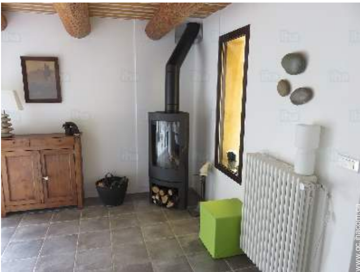
coin du feu