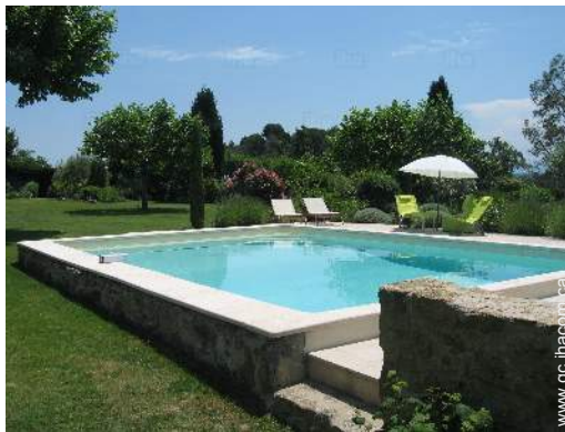
vue sur piscine