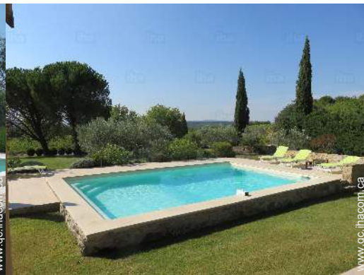
vue sur piscine